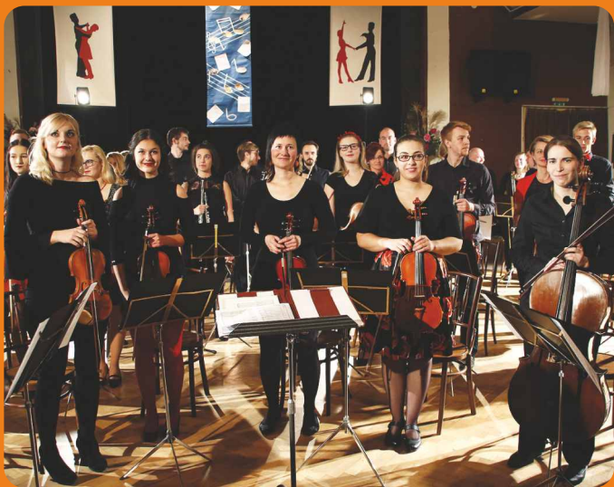
KONCERT NOVOMĚSTSKÉ FILHARMONIE

Oblastní charita Červený Kostelec vás srdečně zve na benefiční koncert Novoměstské filharmonie s pořadem „ Jména “