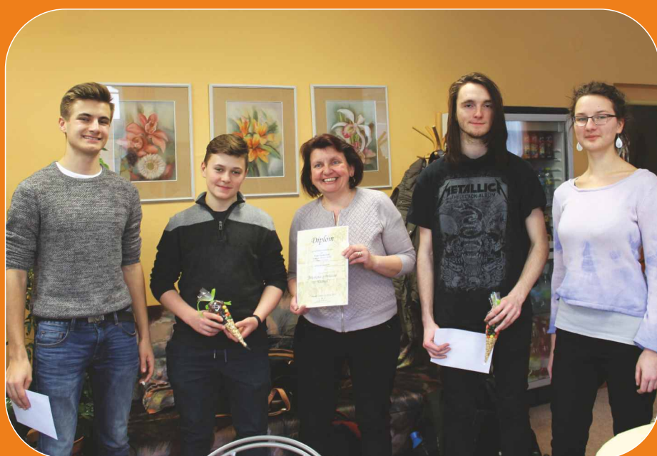
STUDENTI POMÁHAJÍ NAŠEMU HOSPICI