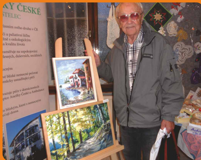
LETOS SE KONAJÍ OPĚT ŠIKOVNÉ RUCI PRO HOSPIC

Místem startu bude opět Středisko volného času Háčko, Manželů Burdychových 245, Červený Kostelec. Sledujte stránky www.behprohospic.cz a přijďte si zaběhat.